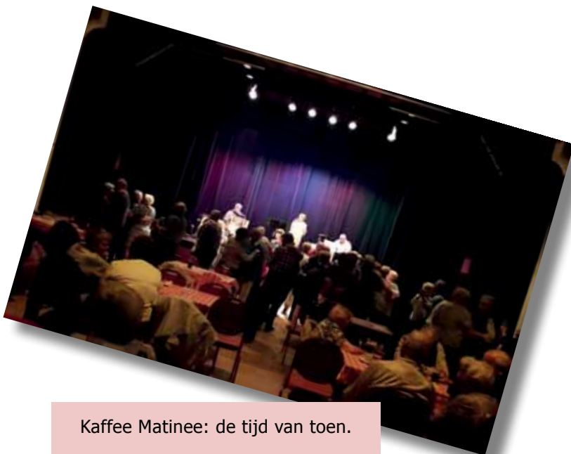
Kaffee Matinee: de tijd van toen.