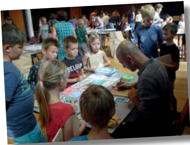
Ezelsoor: kافتen van de schoolboeken in de BIB.